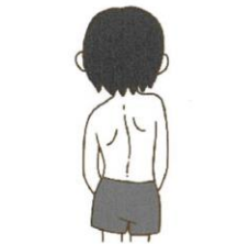
側わん症や不良姿勢