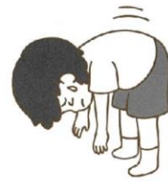
前屈できない・痛い