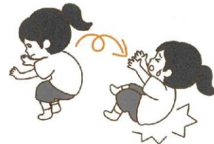
しゃがみ込みできない