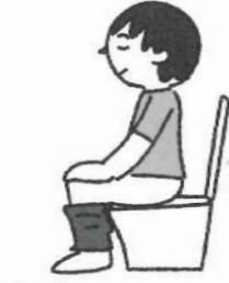
学校がある日と同じ時間にトイレに行く