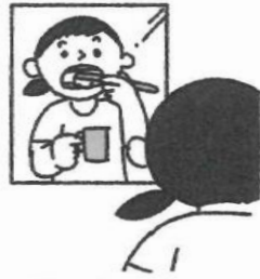
ご飯を食べたあとは歯みがき