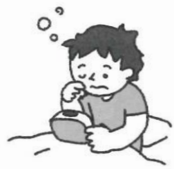
学校がある日と同じ時間に起きる