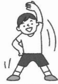
毎日、適度に運動(熱中症には注意！)