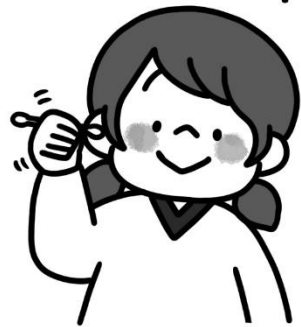
耳の入り口あたりをぬぐう感じで