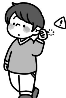
耳かき棒を奥に入れる、歩きながら、などはケン